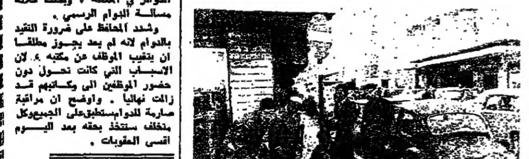
نموذج اخر لخدمة جنوبية